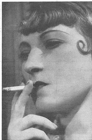
Orane Demazis, la célèbre Fanny, dans «Angèle». Un film de Marcel Pagnol. (D.F.G., Genève.)

— Verlängerung der Nachlassstundung Prorogation du sursis concordataire Ct. de Berne. — Arrondissement de Porrentruy. Par ordonnance du 11 septembre 1934, le pré-