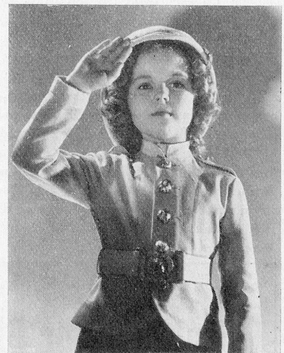
Shirley Temple in: « Ein guter Kamerad » (Wee Willie Winkie), Film der 20th Century Fox.