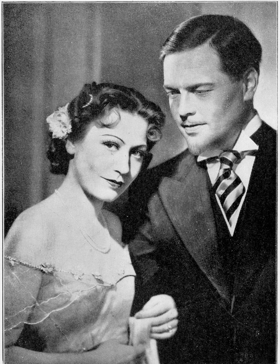
Heli Finkenzeller · Hans Brausewetter spielen die Hauptrollen im Ufaton- film „Mein Sohn, der Herr Minister“