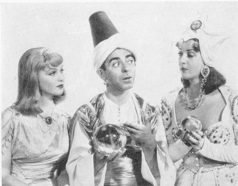
Der berühmte Komiker Eddie Cantor umgeben von Louise Hovick und June Lang im 20th Century-Fox Großfilm « Ali geht zur Stadt ».

Von der Filmpropaganda sollen alle Tages- und Fachzeitungen erfaßt werden, wobei die ersten Anzeigen nach dem 1. September erscheinen und bis zum 31. Dezember durchgeführt werden. Hollywood