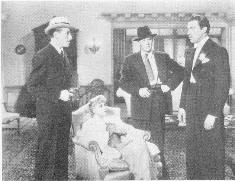
Une scène inattendue de «L'AUDACIEUSE» (15 Maiden Lane) avec CLAIRE TREVOR et CESAR ROMERO; film: 20th Century-Fox.

Aufregende Szene aus dem 20th Century-Fox-Film «Mord im Zentralpark», mit Claire Trevor und Cesar Romero.