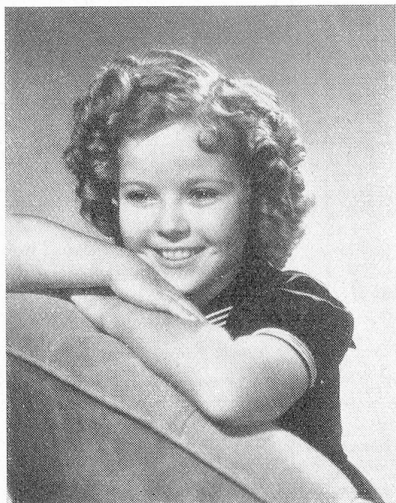
Shirley Temple in ihrem neuen Film «Heidi». 20th Century-Fox.

In der außerordentlichen Generalversammlung vom 30. Mai 1938 haben die Aktionäre der «Capitol-Theater Aktiengesellschaft», in Zürich (S.H.A.B. Nr. 208 vom 7. September 1937, Seite 2049), Betrieb von Kinematographen-Theatern, die