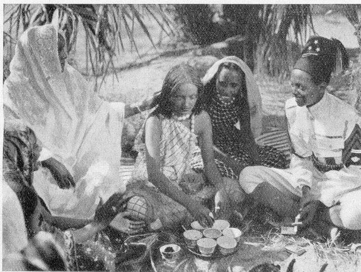
Szenenbild aus dem großen Kolonialfilm «Die schwarze Wacht». Verleih: Sefi, Lugano

Anfragen, die mit diesem Wettbewerb zusammenhängen, werden nicht beantwortet.