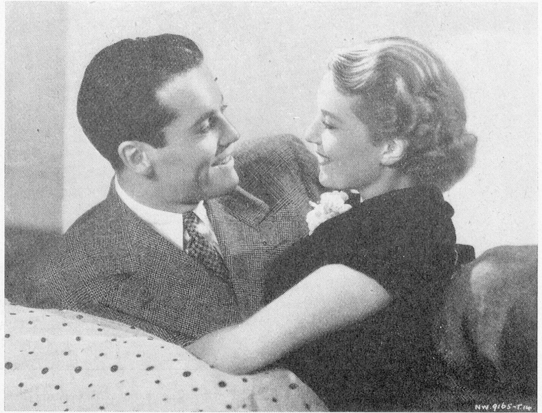
Ein reizendes Paar: Annabella/Henry Fonda in «Das Schloss im Mond».

Die Verhandlungen wegen der Uebernahme der United Artists Picture Corporation durch Alexander Korda von London Films und Goldwyn sind zum Ab-