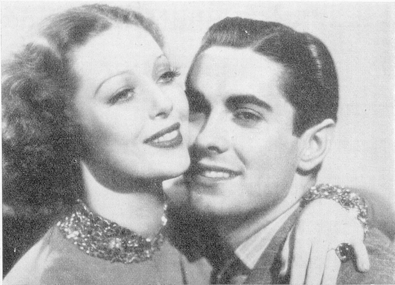
«Café Metropole» mit Loretta Young und Tyrone Power. 20th Century-Fox.

schluss gekommen. Es handelt sich dabei um die Erwerbung der im Besitz von Mary Pickford, Chaplin und Fairbanks sen. befindlichen Aktien der United Artists. Englische Filmzeitungen glauben zu wissen, dass das Geld für die Finanzierung in England aufgebracht worden sei. Korda hofft, durch diese Uebernahme seinem Film auf dem amerikanischen Markt eher Eingang zu verschaffen.