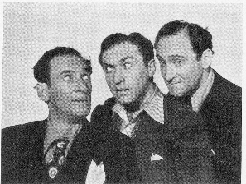
«Gehn wir bummeln» — die drei aussergewöhnlichen Komiker Ritz Brothers.