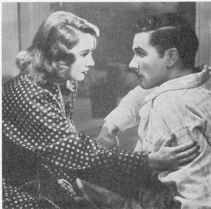
Joan Blondell und Errol Flynn in «Ein Mann ist verschwunden». Im Verleih der Warner Bros.