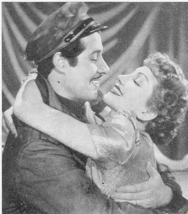
Claudette Colbert und Don Ameche in einer reizenden Szene aus dem Paramount-Großfilm «Mitternacht». Regie: Mitchell Leisen, Verleih: Eos-Film A.-G., Basel.

zweifelhaft, daß die Kinder es so erwarten und daß die Rechtfertigung des Tugendhaften, des Unterdrückten oder des hart Geprüften ihr elementares Rechtsgefühl befriedigt.» — Es besteht eine gewisse Gefahr, daß das Thema Kinder und Film zu sehr vom Standpunkt des Erwachsenen aus behandelt wird und ohne Rücksicht auf den Geschmack der Kinder selbst. Man sollte sich bemühen, herauszubekommen, was den Kindern im Kino gefällt, und die Aufgabe, ihren Geschmack zu erziehen und