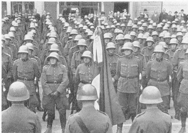
Feldgottesdienst (Szene aus dem schweiz. Film: Unsere Armee ). Service religieux (Scène du film suisse: NOTRE ARMEE) . Monopol-Films A.G., Zürich.

Der Verstärker enthält neben dem Gleichrichterteil die gesamte Vor- und Endverstärkung in drei Stufen zusammengefaßt und liefert außerdem auch den Heizstrom für die Tonlampen im Lichttongerät. Der hohe Wirkungsgrad der Fotozelle und des Lautsprechers gestatteten es, den Verstärker verhältnismäßig klein zu halten. Daher sind die Kosten für Stromverbrauch und Röhrenersatz im Vergleich zur aufzubringenden Leistung sehr gering. Durch einen eingebauten Lautstärke-Regler kann die Lautstärke der jeweiligen Besetzung des Theaters angepaßt werden. Trotz seiner Kleinheit besitzt der Verstärker einen besonderen Tonabnehmerzugang für den An-