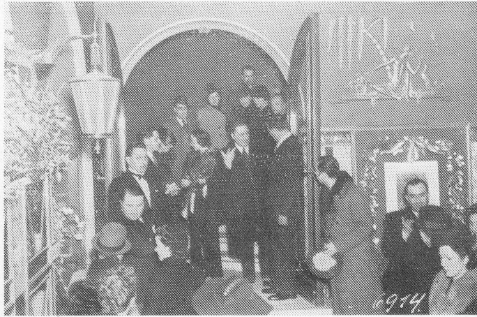
Die Premiere des «VERDI-FILMES» gestaltete sich in Bern im Cinéma Splendid zu einem gesellschaftlichen Ereignis. Hohe Persönlichkeiten im Foyer des Cinéma Splendid in Bern (s. Exc. A. Tamaro im Gespräch mit Germana Paolieri und dem Regisseur Garmine Gallone).

Die «Cinématographie Française» veröffentlicht, wie alljährlich, eine aufschlußreiche Statistik über die Lage des französischen Filmmarkts. Im Jahre 1938 wurden in Frankreich 427 Großfilme vorgeführt, darunter 122 französische Filme, die in Frankreich gedreht worden sind (gegenüber 111 im Vorjahr) und 14 Filme in französischer Sprache, die im Ausland gemacht wurden. Das Hauptkontingent stellten wieder die Vereinigten Staaten mit 239 Filmen (gegen 230 im Vorjahr). Der Anteil deutscher Filme ist erneut gesunken, bis auf 26 (gegenüber 31 im Vorjahr und 113 im Jahre 1933); dabei sind hier bereits elf Filme inbegriffen, die von deutschen Firmen (vor allem von der Ufa und der Tobis) in französischer Sprache hergestellt wurden. Auch England hat etwas verloren, verzeichnete nur noch 21 Filme (gegen 29); die russische Produktion ist nahezu völlig verdrängt, man zeigte nur noch 1 Film gegenüber 14 im Vorjahre, offenbar, weil ein Austausch unmöglich geworden ist. Dazu kommen 6 Filme in jiddischer Sprache, 5 italienische und 2 tschechoslowakische Filme, sowie je ein Film aus Belgien, Holland, Polen, Ungarn und Australien. Insgesamt 219 Filme wurden in der Originalversion und Originalsprache vorgeführt, 14 davon waren Farbfilme. ar.