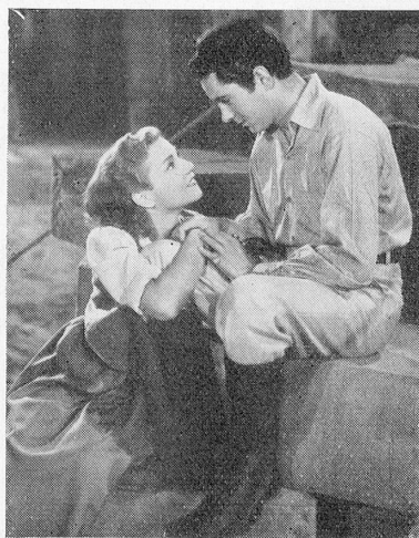
Tyrone Power et Annabella dans «Suez», le beau film de la 20th Century-Fox.

Das «Museum of Modern Art Film Library» in New York hat ein Programm aus 4 großen Filmen zusammengestellt, die ungefähr 25 Jahre alt sind. Das Programm enthält folgende Ausschnitte: Aus «Cinere» einige Szenen mit Eleonora Duse, in denen sie, die Sechzigjährige, ein junges Mädchen spielt, einige Ausschnitte aus «Madame Sans Gêne», mit Réjane, einen Teil des ersten Filmes nach Dumas «Dame aux