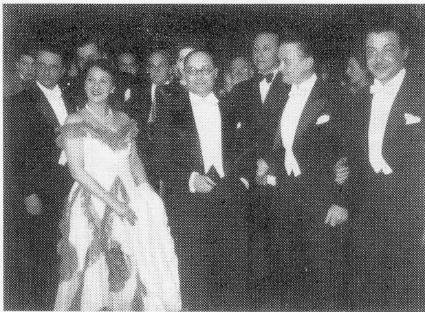
Von links nach rechts: Lotte Schöne, Unterrichtsminister Jean Zay, Regisseur Duvivier und Fernand Gravey