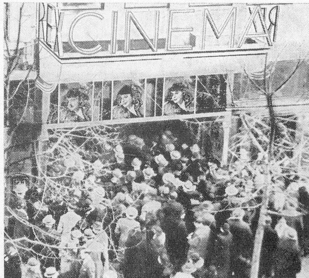
Das Gedränge vor dem Cinéma Rex in Zürich, anlässlich des persönlichen Besuches von Zarah Leander am 3. Januar zum Ufa-Film: «Der Blaufuchs.»

Die Szenen, die sich in den Theatern in Basel und Zürich unter dem Publikum abspielten, das Zarah Leander sehen wollte, sind unbeschreiblich und unvorstellbar. Ganze Polizeitrupps waren notwendig, um dem stürmischen Gedränge und den teils leidenschaftlich um ihre Plätze kämpfenden Besuchern Einhalt zu gebieten. Aus allen Teilen der Schweiz kamen Leute hergereist, die ihren Filmliebbling persönlich sehen wollten. Tausende mußten wieder umkehren, weil die Theater überfüllt waren.