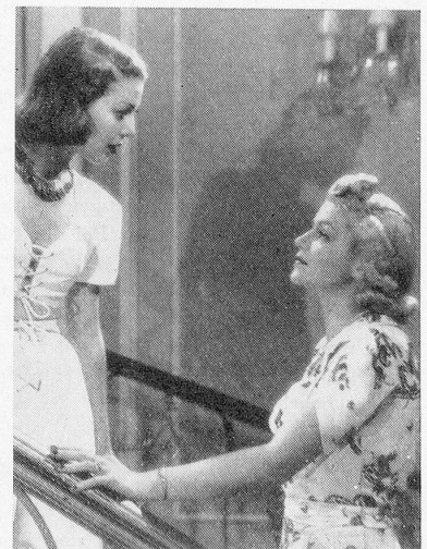
Meine Frau sucht einen Mann. Loretta Young et Claire Trevor dans le beau film «J'ai deux maris» (Second Honeymoon). 20th Century-Fox.