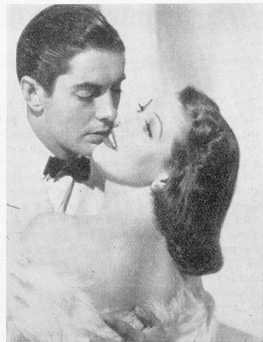
Meine Frau sucht einen Mann. Nous retrouvons le couple idéal. Loretta Young et Tyrone Power dans le beau film de la 20th Century-Fox «J'ai deux maris» . Second Honeymoon.)