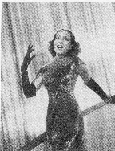
Shanghai, internationale Niederlassung. Nous reverrons la très belle Dolores del Rio dans «Concession internationale» (International settlement.) Film de la 20th Century-Fox.

Weitere Filme der Produktion 1940/41 befinden sich in Vorbereitung und werden demnächst in Angriff genommen, darunter Großfilme von sensationellem Ausmaß. Alle großen und beliebten Stars, Regisseure und Komponisten der letzten Jahre sind wieder bereit, den neuen Filmen die notwendige Zugkraft zu geben. Auch im neuen Geschäftsjahr werden wir mit einer Produktion aufwarten können, die Ihre Erwartungen in jeder Hinsicht erfüllt.