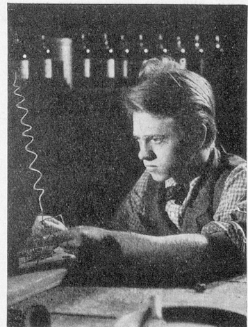
Die Jugend- und Lausbubenzeit des großen Erfinders Thomas Edison.

Besonders bemerkenswert sind auch die Ueberläufer aus der letztjährigen Produktion, darunter «Die Geierwally», in Zürich und Basel mit Riesenerfolg bereits angefallen, sodann fertiggestellt: «D III/88», der unerhört spannende Fliegerfilm, ferner «Die 3 Codonas», der sensationelle Film aus dem Artistenleben auf Grund wirklicher Begebenheiten, der große Hans Albers