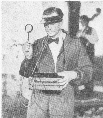
Abb. 2. Handhabung des Collux im Atelier

Die Photozelle des Collux ist eine Sperrschichtzelle, die an einem genügend langen als Handgriff dienenden Stiel befestigt ist. Vor der Zelle befinden sich fest eingebaut ein Ausgleichsfilter zur Korrektur der Farbmempfindlichkeit und eine mattierte Opalglasscheibe. Eine zweite Opalglasscheibe von genau festgelegter Lichtdurchlässigkeit ist aufsteckbar angeordnet. Sie wird nur bei Atelieraufnahmen abgenommen. In diesem Fall wird der Knopf E (Abb. 1) gedreht, durch den eine zweite Blendenreihe sichtbar wird, die sich durch einen roten Untergrund von der ersten unterscheidet. Aufsteck- und Ausgleichsfilter sind so bemessen, daß das Licht in einem großen