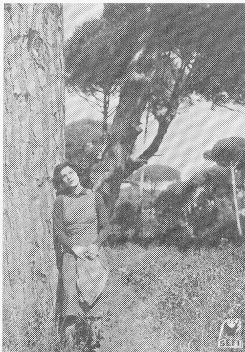
Luisa Ferida in einer Szene des Films «Argine».

David O. Selznik hat die anfänglich Widerstrebende, die ihr Heim und ihre Familie in Stockholm nur ungern verlassen wollte, über den Ozean gelockt. Als Partnerin von Leslie Howard verkörperte sie in dem Film «Intermezzo» die gleiche Rolle, die sie bereits in Schweden gespielt hat. Schon vor der ersten Vorführung des Films war sie berühmt, überall sprach man von ihrem ungewöhnlichen Talent. Dem Filmdebüt folgte sofort ein Theater-Engagement nach New York, wo sie am Broadway in