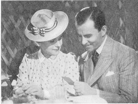
«Ein glückliches Paar!» Paula Wessely als Agnes Seethaler mit Joachim Gottschalk, ihr neuer Partner, der den Diplomaten von Gallas darstellt.

Die Gastwirtstochter Agnes Seethaler lebt in einer kleinbürgerlichen Welt, in welche eines Tages der Diplomat v. Gallas eintritt und die Bekanntschaft mit dem zurückgezogenen Mädchen macht. Nach Tagen eines kurzen Glücks verschwindet der Weltmann wieder aus dem Gesichtskreis des Mädchens, das aber fest daran glaubt, daß er eines Tages wiederkehren wird. Ihre Hoffnung stirbt auch nicht nach der Geburt des Kindes, dessen Vater der Fremde ist, sondern sie hat die Kraft, sich geschäftlich empor zu arbeiten und nach vielen Jahren beim Wiedersehen mit dem Mann ihrer Wahl ein zwar spätes, aber wohlverdientes Glück zu finden. — Paula Wessely schuf mit der Agnes Seethaler die schönste Rolle ihres ruhmreichen Lebens. Die Regie führte Gustav Ucicky.