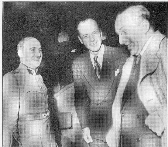
Un visiteur de marque, fidèle du «Métropole»: S. M. Alphonse XIII., l'ex-roi d'Espagne, qui échange d'aimables paroles avec M. le Conseiller National Pierre Rochat.