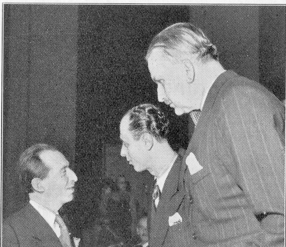
M. le Conseiller Fédéral Enrico Celió assiste en compagnie de M. le Conseiller National Henry Vallotton à la présentation au «Metropole» du film officiel de l'Exposition Nationale.