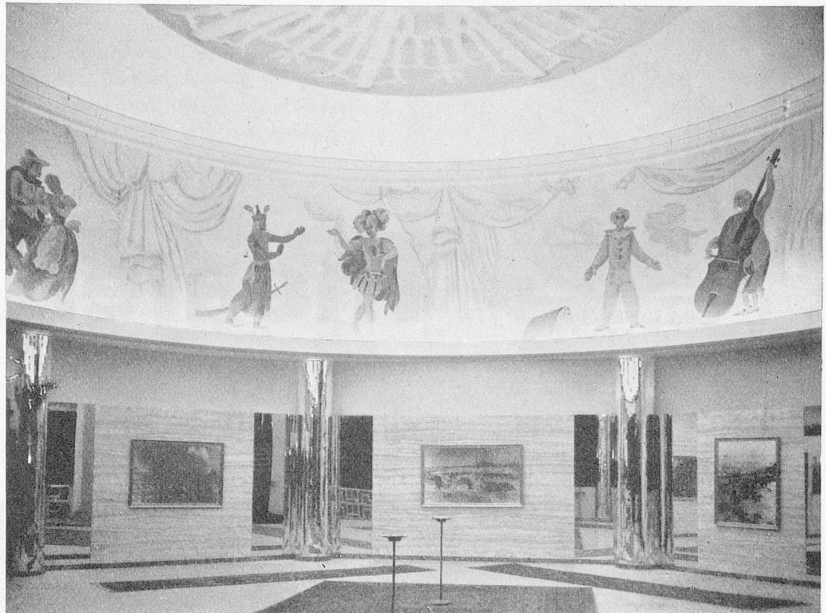
Le hall du METROPOLE est actuellement, de l'avis général, le plus beau de Suisse.

Inutile d'anticiper. Quand on connaît sa remarquable activité à Lausanne, l'on peut être certain que lorsqu'il aura à sa disposition encore une des meilleures salles genevoises, M. Fuchs va donner un immense essor aux spectacles dans ces deux villes. Et, nos meilleurs vœux l'accompagnent dans la laborieuse tâche qu'il entreprend avec un si grand entrain. J. Vr.