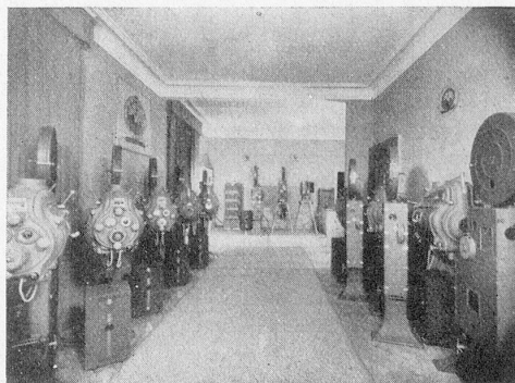
Teilansicht unseres Vorführungsraumes in Zürich

Die Theatermaschinen werden auf Wunsch mit 1300-Meter-Feuerschutztrommeln geliefert.