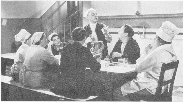
Eine Szene aus dem Film «De Hotelportier» Verleih: Pandora-Film A.G., Zürich

diese Vorführungen 50 Pfennige. Vorstellungen ununterbrochen von 10 Uhr vormittags bis 11 Uhr abends.» So umständlich stand es auf den Plakaten zu lesen, die das Publikum zu einem Besuch in einem Kino überreden sollten. Allerdings war es damals auch etwas riskant, ein Kino zu besuchen; denn nicht nur, daß sich die schrecklichsten Schieß- und Diebesszenen in wilder Folge vor dem unschuldigen Zuschauer abspielten, er mußte sich in die Ohren zwei Schläuche stecken, um nicht nur zu sehen, sondern auch zu hören. Meßter hatte aber diese «Schlauchtechnik» bald überwunden, wie sein Plakat anzeigt.