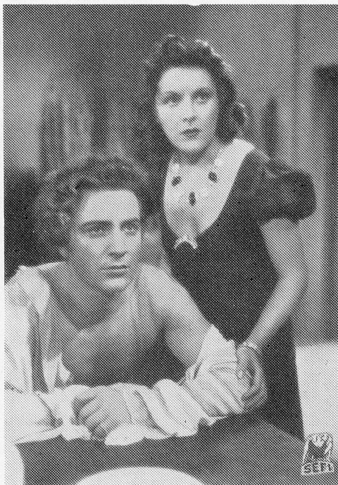
Imperio Argentina und Rossano Brazzi in dem Großfilm «TOSCA». Prod. Scalera-Film Rom.

Allen Schwierigkeiten zum Trotz, scheinen die englischen Filmkreise gewillt, die Farbenfilm-Produktion, die vor dem Kriege