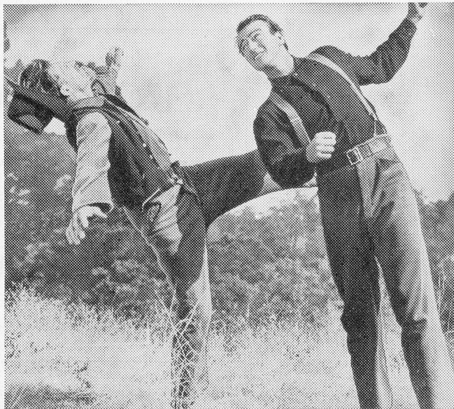
The Shepherd of the Hills.

Die Marx Brothers feierten einen großen Triumph mit ihrem letzten Film «Skandal im Wilden Westen». Sie sagten sich, nun sei es aber genug mit den Wildwest-Filmen, sie wollten diese Sorte einmal auf den Kopf stellen... und wie sie das getan haben! Dieser Film gehört tatsächlich zu den erheiterndsten und drolligsten Schöpfungen dieser Könige des Humors!