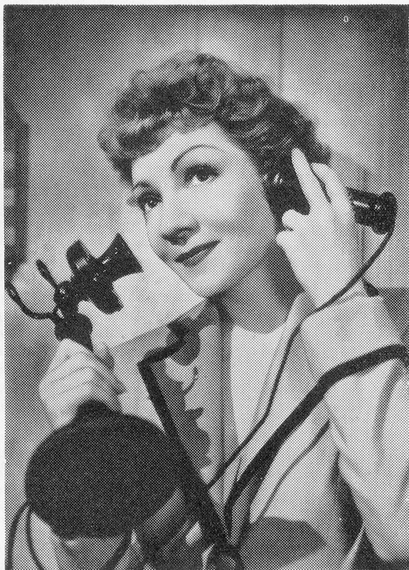
Claudette Colbert spielt eine Hauptrolle im Paramount-Film «Liebe erwache».

Dans la langue d'Hollywood, un «trend» signifie le genre de films «qu'il faut réaliser». Le «war-trend» est déjà dépassé, les films d'actualités et de guerre n'ont pas eu le succès escompté, et c'est étonnant qu'on en fasse encore; la M-G-M tourne «China Caravan», film sur la Route de Birmanie, et la RKO «Joan of Paris», avec Michèle Morgan. Mais ce qu'on cherche surtout, c'est l'oubli et le divertissement. Les films musicaux sont donc au premier rang, tout comme les comédies et les films policiers avec une note comique,