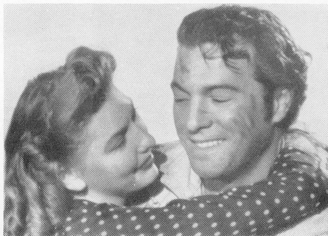
Une scène du grand film d'aventures et d'amour «Abbandono».

Le succès des films britanniques aux Etats-Unis se reflète le mieux dans l'accroissement des prix de vente. Un nouveau