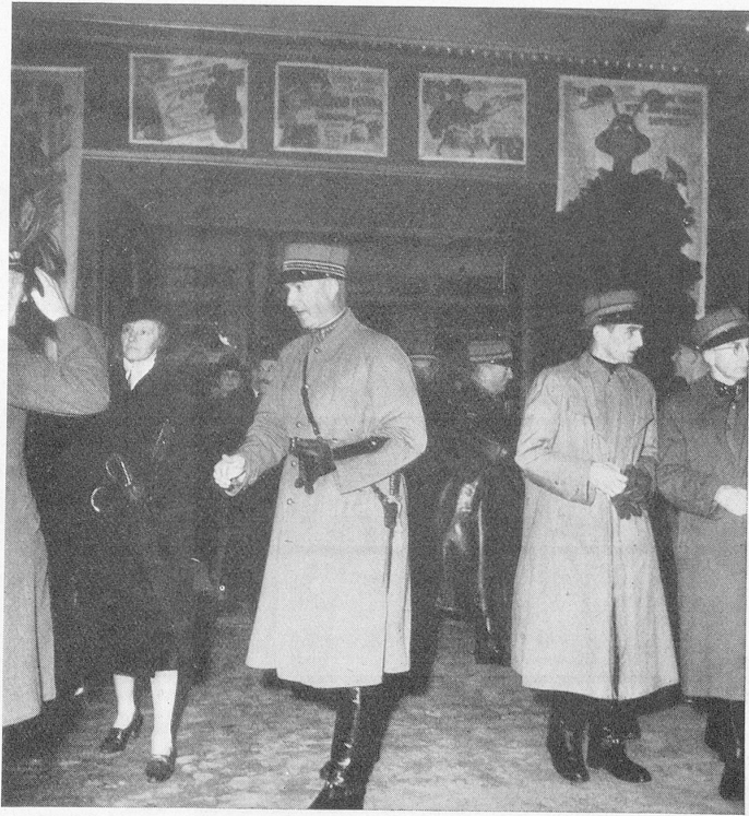
Von der Premiere des großen Heimatfilms «Grenzwacht in den Bergen.»

Dokumentarfilme. Das einstige Stiefkind der Kinobesitzer ist jetzt ein Lieblingskind geworden. Jedes Theater verlangt mehr Dokumentarfilme. Das Publikum will keine verkitschte Darstellung der Weltgeschichte sehen, sondern Tatsachen, die Wahrheit. Kein Geringerer als Major Frank Capra,