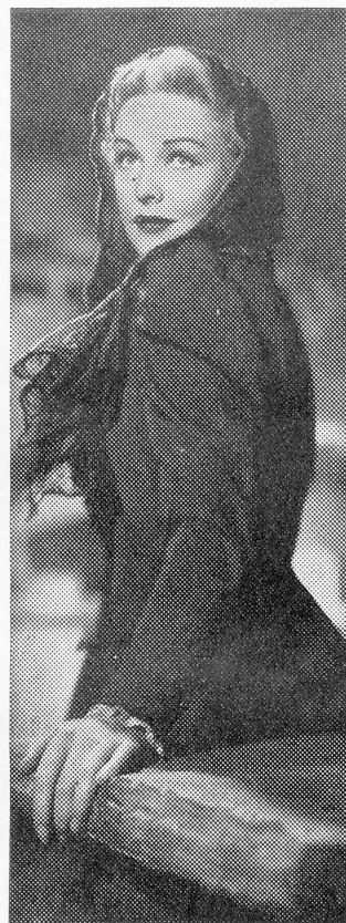
Madeleine Carroll ist die Partnerin von Gary Cooper in der Paramount-Technicolor-Production «Herzen in Flammen».

Und ohne alle Mühe können wir uns denken, daß die Schweizerfilme in Venedig nicht vom politischen, sondern vom rein kulturellen Standpunkt aus beurteilt werden. «Landammann Stauffacher» war für uns ein nationales Ereignis, war der Film unserer Nation, und jeder Schweizer nahm diesen Film mit einem Gefühl des tiefen Dankes an seine Hersteller hin. Sollen wir diese unsere nationalen Gefühle aber im Ausland zu Markte tragen, um vielleicht eine gnädige Anerkennung am Rande dafür zu ernten? Das Ausland wird auch so an unsere nationale Kraft glauben müssen, ob es den «Landammann Stauffacher» gesehen hat oder nicht. Wir hätten es lieber gesehen, wenn dieser kostbare Streifen innerhalb unserer Grenzen geblieben wäre. — So wir aber nach einem künstlerischen wertvolleren Film Umschau halten, wird uns die Tatsache enttäuschen, daß der Film «Romeo und Julia auf dem Dorfe» nicht nach Venedig geht. Keiner hätte es eher verdient, als dieses Produkt der Pro-Film A.-G. Und das Ausland hätte es uns wieder nicht verargt, wenn man zum zweitenmal Gottfried Keller'sche Verfilmungen hätte prämiieren müssen!»