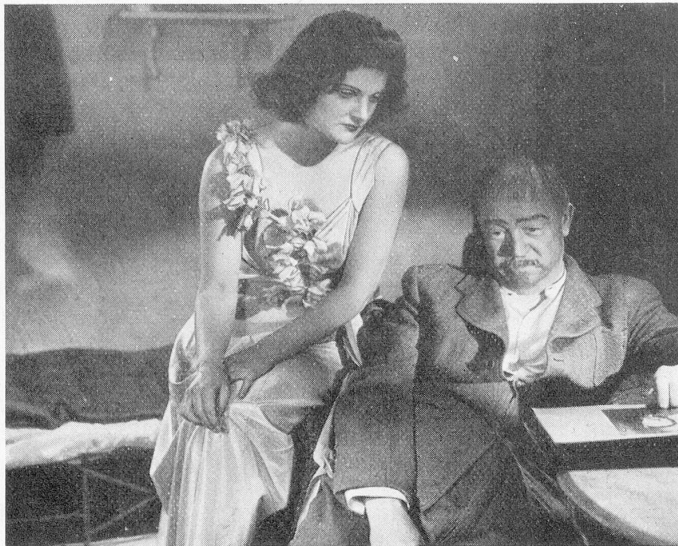
«Zurück auf diesem Weg» Verleih: Neue Coram Film A.G., Zürich.

ner schlägt gottlob seine «Nachrichterzeit» immer wieder durch, die Zeit, in der er als Student mit seinen Freunden auf die Brettl zog und mit seiner natürlichen, ursprünglichen Leichtigkeit alle Professionals ringsum überholte. «Wir machen Musik», das war wieder echter Käutner. Und nun ist er in der Jofa draußen und macht für die Tobis eine «Romanze in Moll». Dabei wirken Marianne Hoppe und Elisabeth Flickenschildt, Paul Dahlke, Ferdinand Marian und Siegfried Breuer mit.