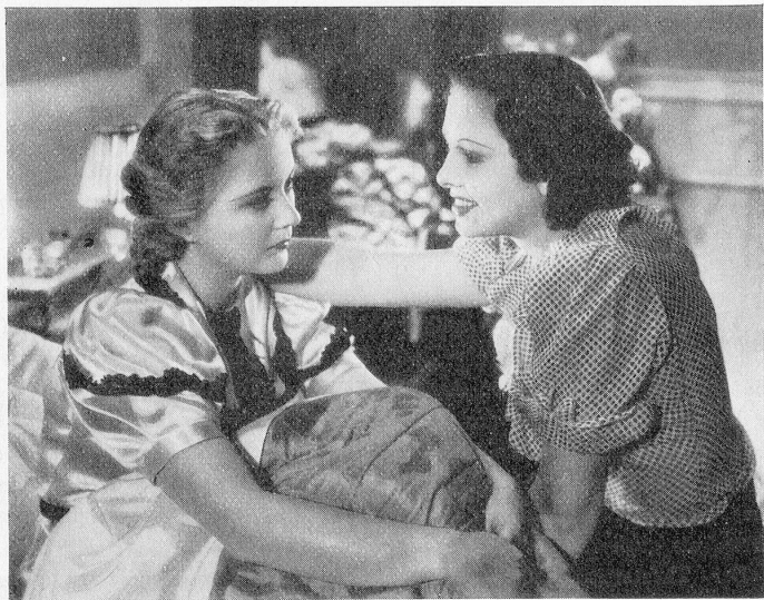
«Wenn Liebe schwindelt»

Helmut Käutner hat sich gerade einen Sondererfolg mit seinem Filmspiel «Wir machen Musik» geholt. Dies ist gewiß der lustigste, fröhlichste und blitzsauberste Film der letzten Zeit. Ein Film, für den man sich herzlich gern einsetzt. Bei Käut-