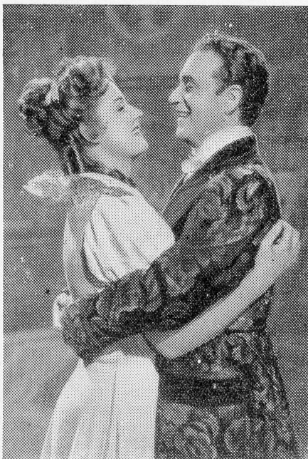
Wieder im sicheren Hafen gelandet

In den letzten Wochen wurden 2 bis 3 Schweizerfilme angeboten, doch diese wurden nicht verkauft; erstens weil sich die Verkaufsgebühren hier und dort geändert haben, zweitens die Themen hier nicht gefallen! Bei normalen Verhältnissen hätte