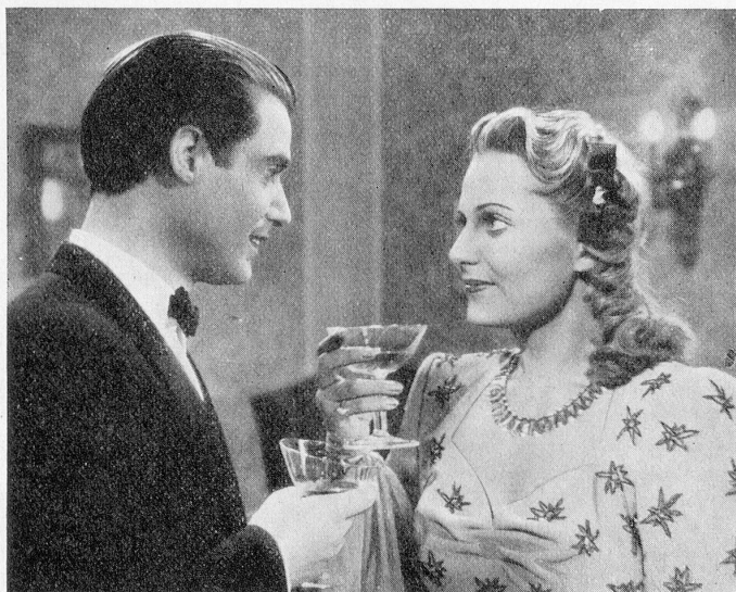
«Sein letztes Lied»

Am 22. Oktober fand die Erstaufführung des Terra-Films «Frau Sixta» im Kopenhagener Kino Pallaet statt. Der Erfolg beim Publikum und bei der Presse war außerordentlich gut.