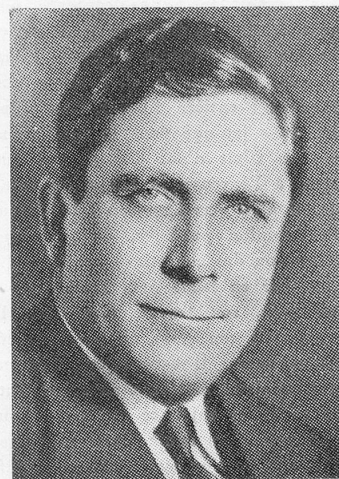
Wendell L. Wilkie Président du Conseil des directeurs de la 20th Century-Fox

En raison du rationnement de l'électricité imposée aux usagers par le Secrétariat d'Etat à la Production Industrielle, et en vue de maintenir l'activité maxima compatible avec les mesures de réduction,