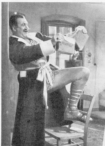
Fritz Kampers als renommierter Muskelprotz