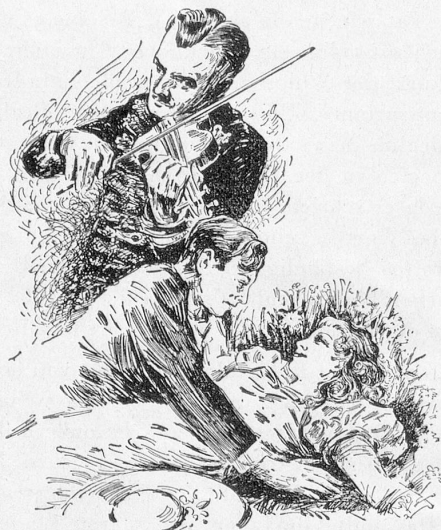
«Zigeunerblut» (Danko Pista) der grosse Musikschlager im Verleih der Elite-Film AG. Zürich.

Die Besprechung eines Filmes soll den unmittelbaren, durch keinen äußeren Druck noch inneres Unbehagen beeinflussten Eindruck des Rezensenten wiedergeben.