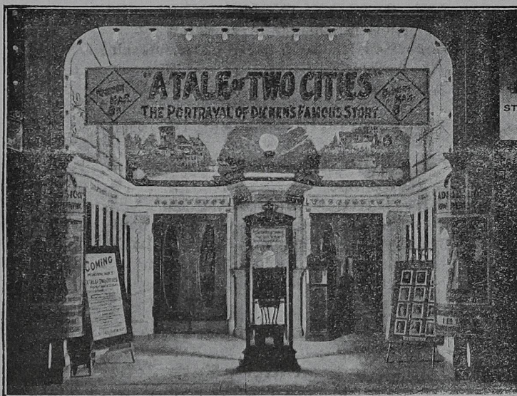
Eingang eines amerikanischen Kinos, wo der Gleichrichter zu Reklamezwecken verwendet wird.