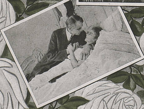
Die weissen Rosen von Havensberg