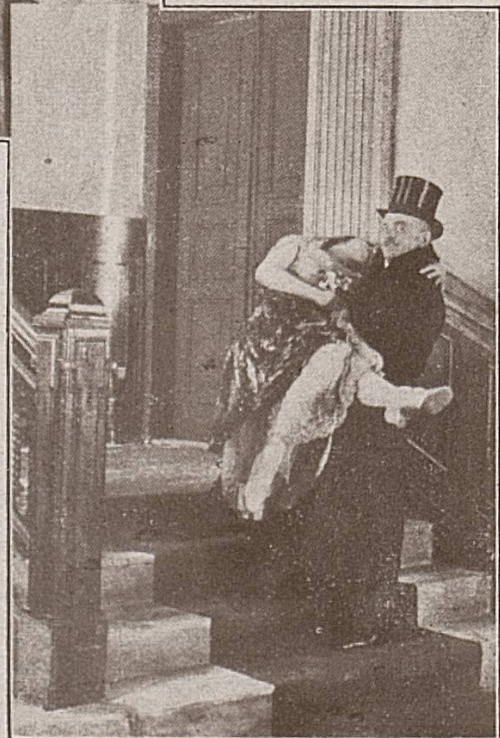
Die süße Last! 2 Uhr nachts