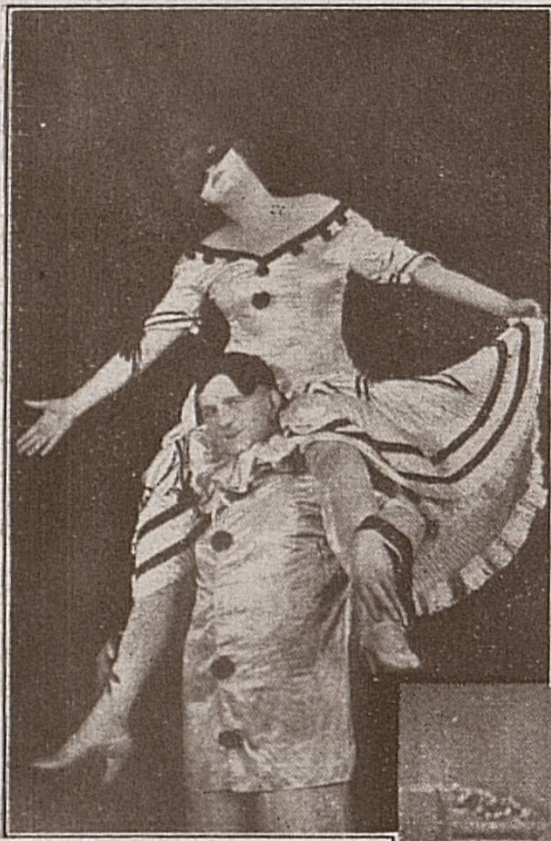
Pierrot u. Pierrette 10 Uhr abends

»2 Uhr morgens« ruft Pierrot und eins der bekanntesten Reznicek-Bilder »die süße Last« bietet sich dem Beschauer dar. Den Abschluß bildet das Kabinettstück mondäner Zeichnungs-Kunst »Gute Nacht« zu der Pierrot erläuternd bemerkt: »5 Uhr morgens.«