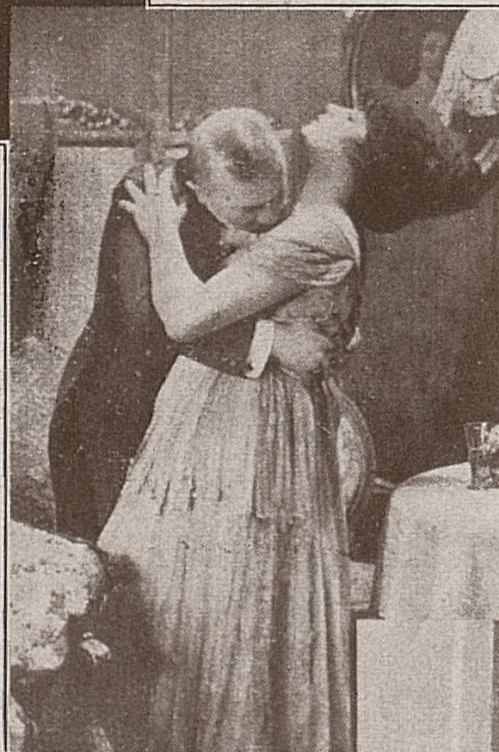
Sektrausch! 1 Uhr nachts

anlehnen. Eine große Firma hat sogar einen führenden sezessionistischen Künstler zu ihrem Beirat erkoren, was hoffentlich nicht zur Folge haben wird, daß wir demnächst auch im Film kubistische und futuristische Experimente bewun-