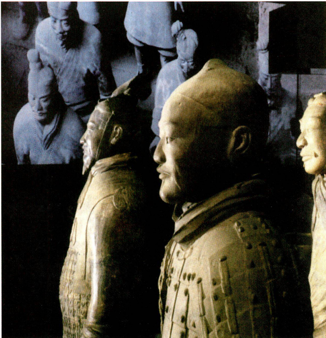
Höhepunkt chinesischer Bildhauerkunst - Die Terrakotta-Armee im British Museum.

Doch nicht nur die Krieger benötigte ein Kaiser im Leben nach dem Tod: Auch an Beamten sowie Schreibern hatte er Bedarf. Vor erst sieben Jahren ist denn auch eine Gruppe von solchen zum Vorschein gekommen, und zwar in einer Grube südwestlich von Shih Huang Tis Grabhügel. Auch Akrobaten und Ringkämpfer fand man, Unterhalter also, und von Überfluss und Beschwingtheit gar zeugt der vorläufig letzte Fund: ein unterirdisch umgeleiteter Fluss und Musikanten aus Terrakotta sowie bronzene