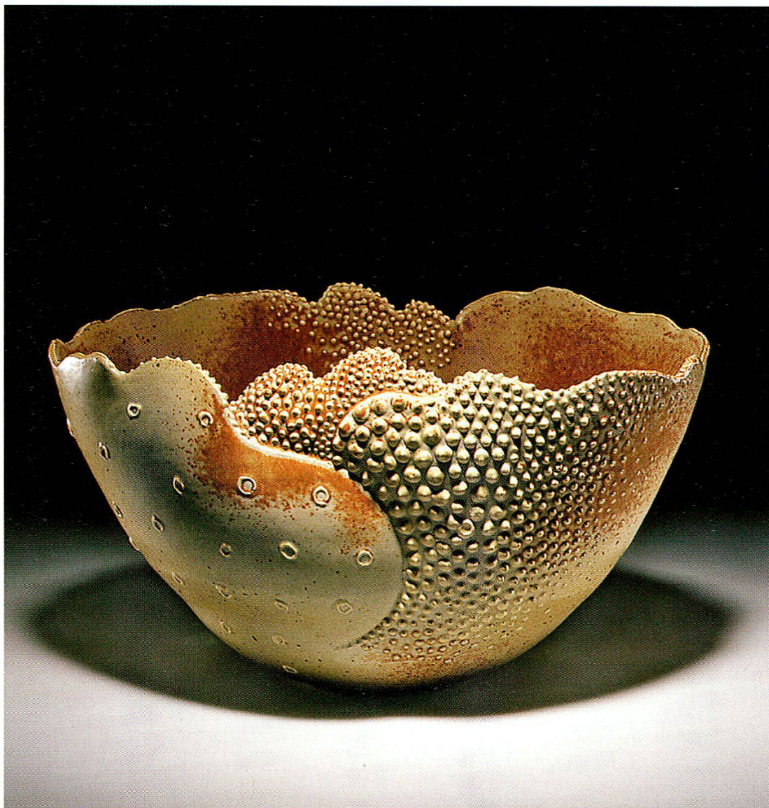
Bol ovale, 2007, Grès émaillé, Larg. 31 cm Coll. de l'artiste