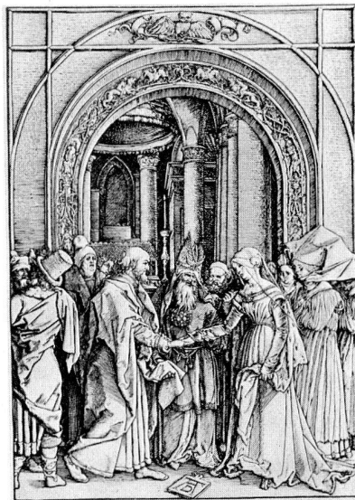
Abb. 4, Albrecht Dürer, Verlobung Maria. Holzschnitt