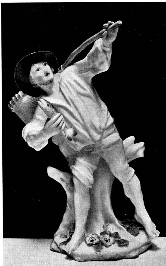
Abb. 2 Fischer, 20 cm hoch, Chelsea um 1755, Marke: roter Anker. Wurde am 6. Juli 1953 bei Sotheby verkauft für 15 600.— Sfrs. (s.S. 16)