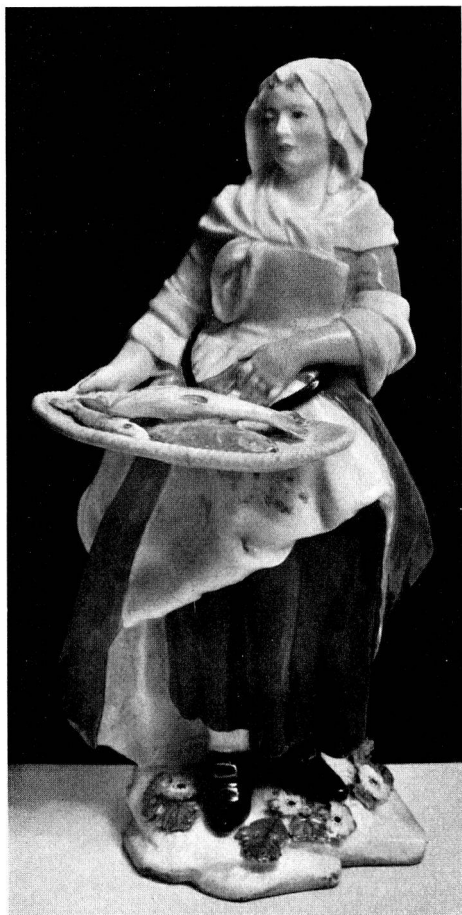
Abb. 1 Fischerin, 21 cm hoch, Chelsea um 1755, Marke: roter Anker. Nach dem „Ford's 1755 Sale Catalogue“ Gegenstück zu einem Zimmermann mit Werkzeugen. Wurde am 24. Nov. 1953 bei Sotheby in London verkauft für 29 250.— Sfrs. (s.S. 16)