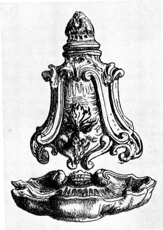
Abb. 9 «Fontaine et civette en Style Rocaille», Zürich um 1765, Marke: Z mit 2 Punkten. (aus Guide de l'amateur de faïences et porcelaines von Aug. Demmin, Paris 1873)