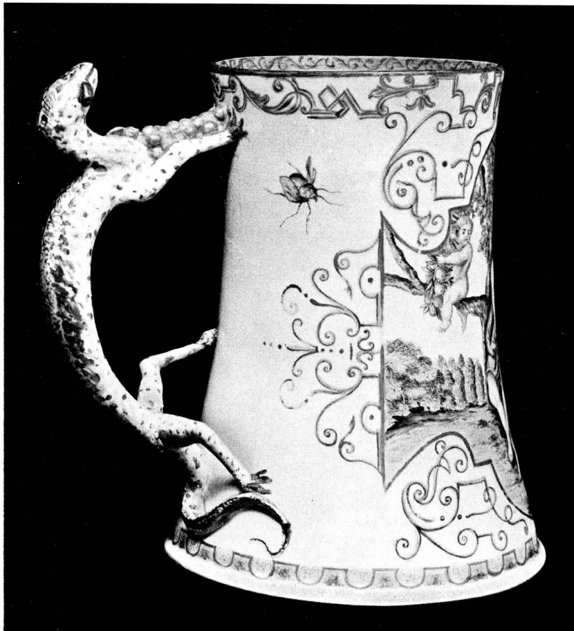
Abb. 7 Seitenansicht des Kruges Abb. 6