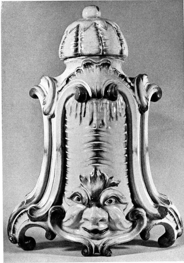
Abb. 8 Giessfass, unmarkiert, in Purpur-Camieu bemalt. Manufactur Frisching, Bern um 1765. Bes.: Musée de Strasbourg, Palais Rohan