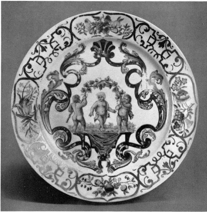
Abb. 13 Teller, Meissner Porzellan, um 1730, bemalt von Hans Gottlieb Bressler in Breslau, um 1732, Schwerter-Marke, Durchmesser 21,3 cm. Slg. Dr. H. Syz, Westport.