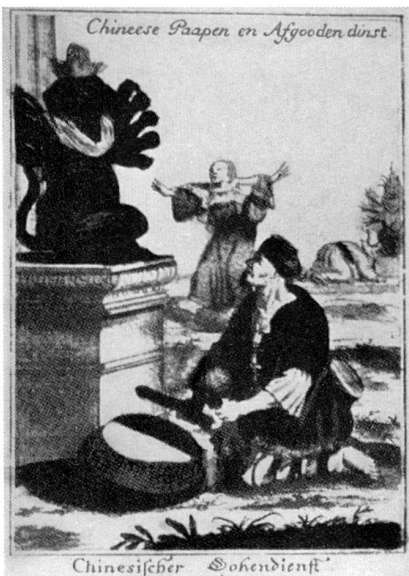
Abb. 9 Vorbild für die Untertasse der Abb. 8. Stich von Martin Engelbrecht in Augsburg, um 1720. (Aus Schulz, s. Anm. 2)