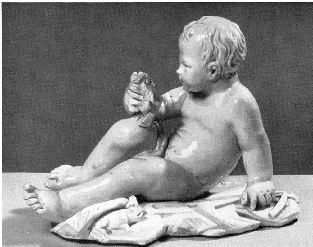
Abb. 15 Putto als Gärtner, Modell von Lücke, in Wien um 1750.