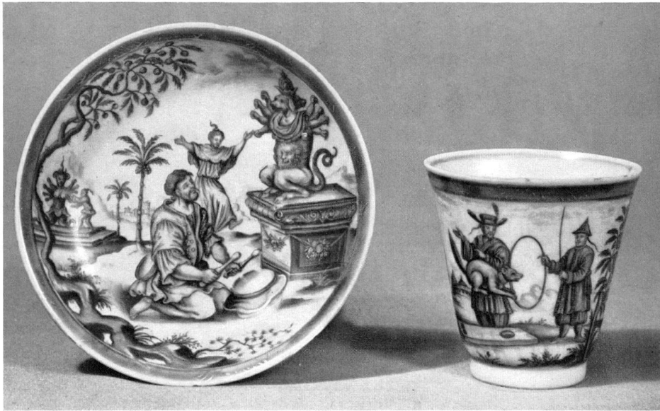
Abb. 8 Tasse und Untertasse, Chinaporzellan um 1700, bläulichgraue Masse mit reliefierter Oberfläche, unterglasurblauer Rand, auf der Tasse chinesische Marke, in Braunrot und Gold bemalt, von Ignaz Preissler in Kronstadt, um 1730, nach einem Stich von Peter Schenk in Amsterdam. Slg. Dr. H. Syz, Westport.