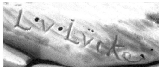
Abb. 12 Signatur Ludwig von Lückes an der Figur Abb. 15.