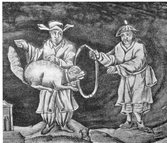
Abb. 10 Zinneinlage aus einem Barockschreibschränk, um 1700, Kunstgewerbemuseum Leipzig. (Aus Pelka, s. Anm. 5)