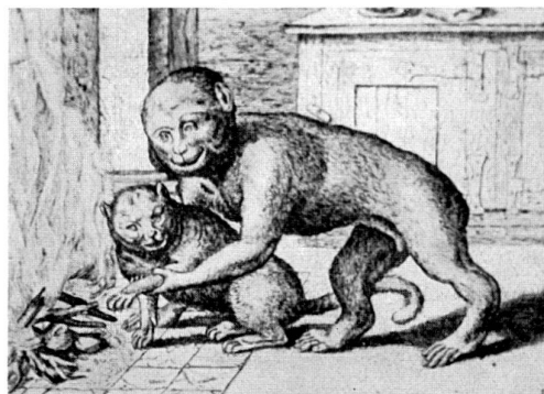
Abb. 27 Stich aus der Folge: « Volucrum pecudumque diversa genera » von Marcus Gerard, d. J. Der Stich geht zurück auf Illustrationen zu den Aesopfabeln des Marcus Gerard, d. Ä., 1567.