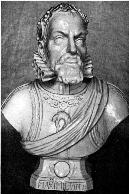
Abb. 13 Büste des Kaisers Maximilian II., von Kändler, 1745, Höhe 34 cm.