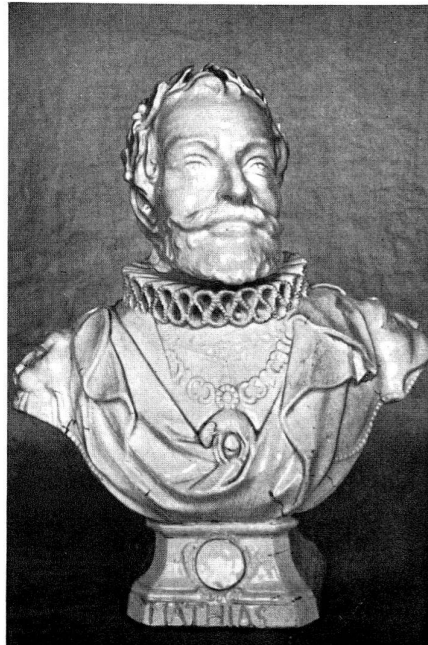
Abb. 14 Büste des Kaisers Matthias, von Kändler, Meissen 1746, Höhe 34 cm.