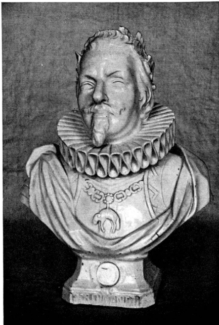
Abb. 15 Büste des Kaisers Ferdinand II., von Kändler, Meissen 1745, Höhe 34 cm.