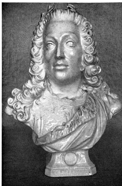
Abb. 18 Büste des Kaisers Karl VII., von Kändler, Meissen 1746, Höhe 37 cm.