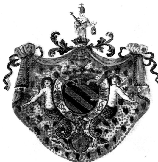
Abb. 20 Wappen aus dem Teller Abb. 19.