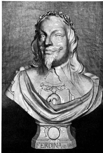
Abb. 16 Büste des Kaisers Ferdinand III., von Kändler, 1745, Höhe 34 cm.