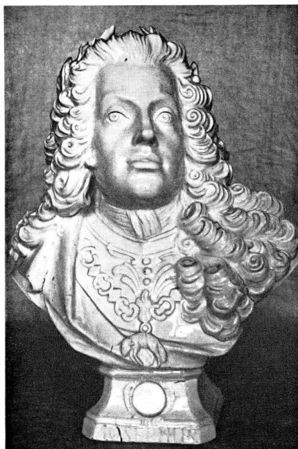
Abb. 17 Büste des Kaisers Josef I., von Kändler, Meissen 1746, Höhe 37 cm.