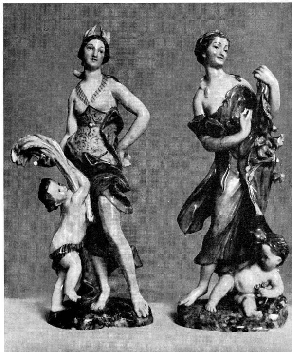
Abb. 7 Sommer und Frühling (Porzellan), von Schubert.