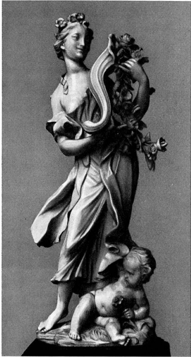
Abb. 5 Frühling (Elfenbein), von Permoser.