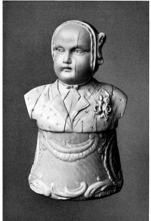
Abb. 11 Kinderkopf (Elfenbein), Privatbesitz.