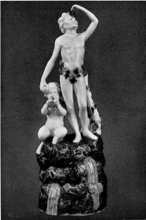
Abb. 10 Bacchus mit Satyr auf einem Felsen (Porzellan) von Hald (signiert mit seinen Initialen)