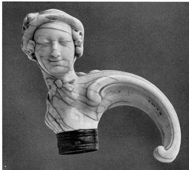
Abb. 12 Stockgriff (Elfenbein), Bustelli zugeschrieben.