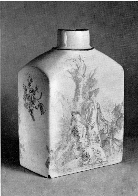
Abb. 9. Tea-caddy, faience with transfer-printed decoration in greyish-blue. Mark as in fig. 6. Mosbach; 1770—72. Ht. 5 in. (approximately 13 cm). Victoria and Albert Museum.