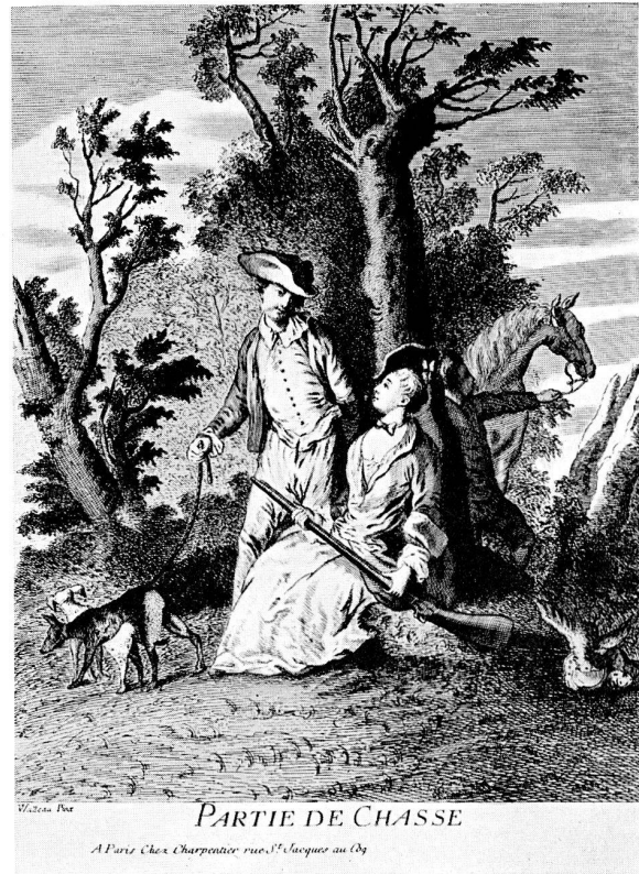
Abb. 12. Engraving after Watteau's Partie de Chasse , used as the source of the decoration on the tea-caddy of figs. 4 and 5. Victoria and Albert Museum.