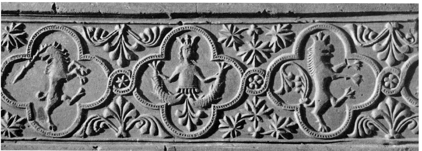
Abb. 7. Vierpassreihe mit marianischen Emblemen. Um 1280.

Abb. 6. Komposition mit Umschrift. Um 1275.