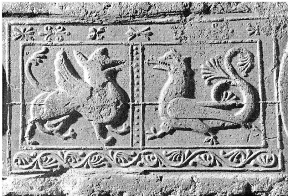
Abb. 2. Modelabdruck mit Darstellungen von Greif und Drache. Um 1265.