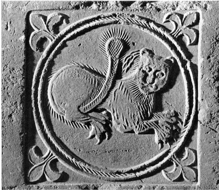
Abb. 1. Backsteinverzierung. Medaillon mit Darstellung des mit wachen Augen schlafenden Löwen. Um 1260.