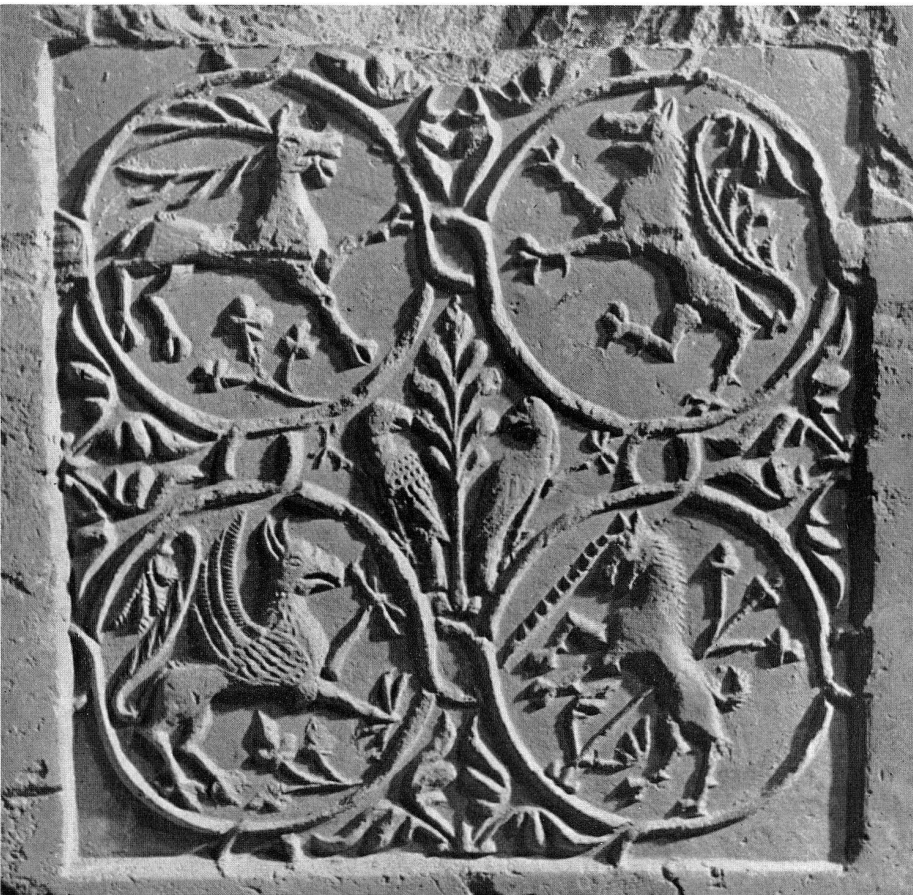
Abb. 9. Modelabdruck mit Emblemen. Um 1280.