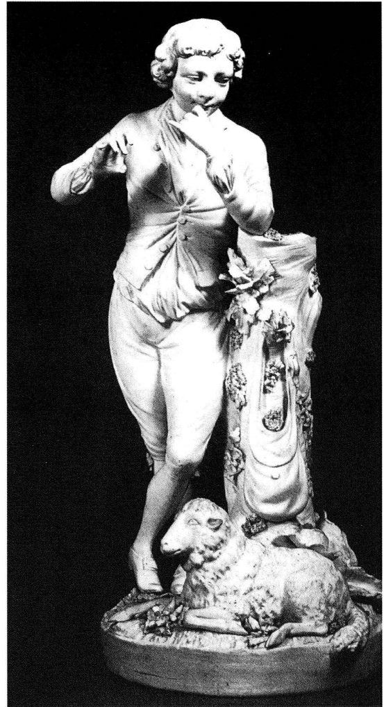
B Gärtner Modell von J.J.W. Spengler Biskuitporzellan, H 24.5 cm Derby 1790/95 (nach Clifford 1978 Abb. 6) In der Haltung erinnert die Figur an den Gärtner Nr. 5