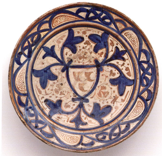
Ill. 6: Plat, Manises, 1400-1450. Faïence, décor peint en bleu de grand feu et au lustre jaune. D. 26,2 cm, H. 6 cm. Musée Ariana – Inv. AR 5116.

d'Aragon, n'a alors pas encore perdu sa population musulmane. L'on sait qu'en 1270, cette dernière demeure très importante, puisque ses effectifs sont estimés à 200'000 mudéjars (musulmans restés en terres chrétiennes), contre 30'000 catholiques. 11 Très actifs dans l'agriculture et l'artisanat, les mudéjars constituent un pilier incontournable de l'économie locale, même après la Reconquête. La culture hispano-arabe survit donc à la disparition d'al-Andalus (1492), notamment à travers l'iconographie déployée sur ses faïences lustrées.