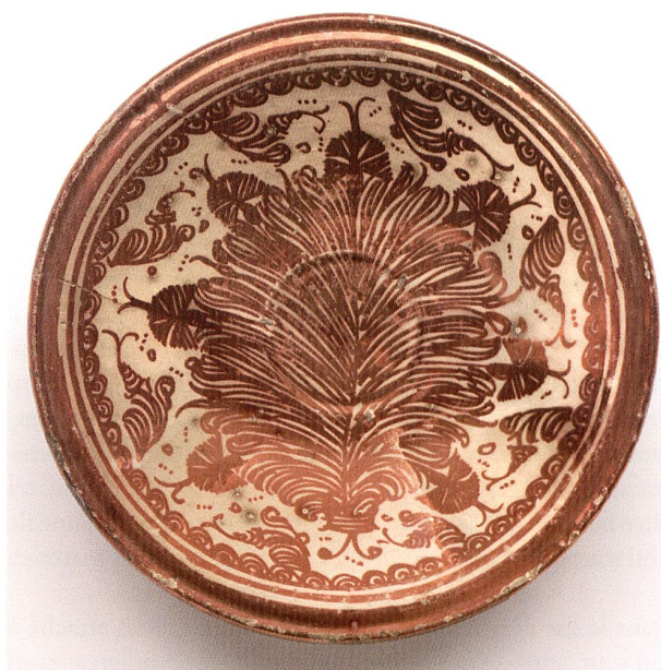
Ill. 9: Plat, Manises, 1700-1750. Faïence, décor peint au lustre rouge. D. 31 cm, H. 7,5 cm. Musée Ariana – Inv. 4894.

En 1609, le roi Philippe III (1578-1621) porte un coup fatal aux descendants d'al-Andalus, en faisant promulguer un décret d'expulsion à l'encontre de tous les Morisques d'Espagne. En l'espace de six ans, environ 275'000 personnes sont exilées (sur un total de huit millions d'habitants), principalement à destination du Maghreb. Les conséquences sociales et économiques varient d'une région à l'autre. La localité de Muel (Aragon) est durement touchée. En 1585, la fabrication de faïence à reflets métalliques y est entièrement aux mains d'artisans morisques (vingt-quatre maîtres potiers répertoriés en 1575). Dès 1610, les ateliers, privés de leur main d'œuvre, sont repris par des potiers de Reus (Catalogne). Ces derniers ne recourent à la technique du lustre que durant une dizaine d'années, avant de l'abandonner au profit de la faïence à décor vert et bleu 18 . La région de Valence perd quant à elle environ 35% de sa population. Même si le procédé céramique y perdure en mains chrétiennes, il semble souffrir d'une baisse de qualité.