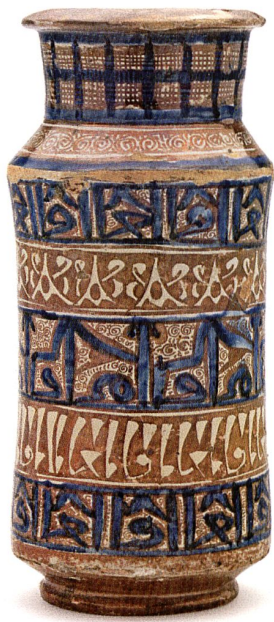
Ill. 2: Albarello, Malaga, XIV e siècle. Faïence, décor peint en bleu de grand feu et au lustre rouge, H. 28 cm, D. 12,5 cm. Musée Ariana – Inv. AR 12375.