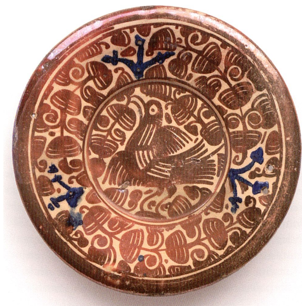
Ill. 8: Plat, Manises, XVIII e siècle. Faïence, décor peint en bleu de grand feu et au lustre rouge. D. 20,6 cm, H. 3,5 cm. Musée Ariana – Inv. R 293.