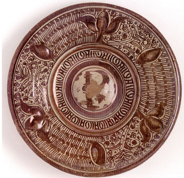
Ill. 7: Plat à ombilic, Manises, 2 e moitié du XVI e siècle. Faïence, décor peint au lustre brun, motifs en relief façonnés à la main. D. 33,6 cm, H. 5 cm. Musée Ariana – Inv. AR 4025.

Au crépuscule d'al-Andalus, l'Espagne se compose de deux royaumes, unifiés par le mariage d'Isabelle de Castille (1451-1504) et de Ferdinand II d'Aragon (1452-1516). Les deux souverains, qui ont à cœur de retrouver l'unité religieuse de la péninsule, décident rapidement de rassembler leurs sujets sous l'étendard de la chrétienté (ils recevront du reste en 1494 le titre de Rois catholiques de la part du pape Alexandre VI, en récompense de la chute de Grenade). En 1492, les Juifs sont forcés de se convertir ou de s'exiler, sort que partagent les Mudéjars en 1502. Par conséquent, la communauté des morisques (mudéjars convertis) déclinera inexorablement tout au long du XVI e siècle.