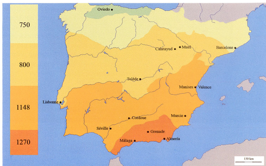
Ill. 1 Frontières d'al-Andalus (711-1492) au fil de la Reconquête chrétienne. (Plan: auteur)