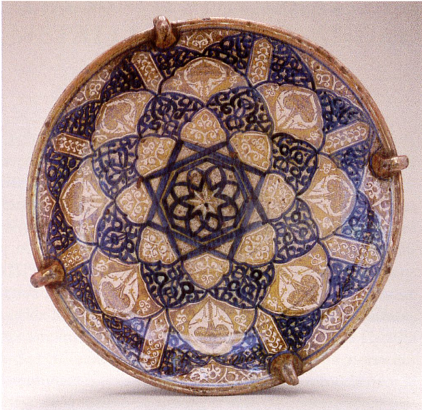
Ill. 4: Bassin creux à bélières Manises (Valence), fin XIV e -début XV e siècle. Faïence, décor peint en bleu de grand feu et au lustre or pâle. D. 48,5 cm, H. 15 cm. Paris (Musée de Cluny) – Cl. 1978.