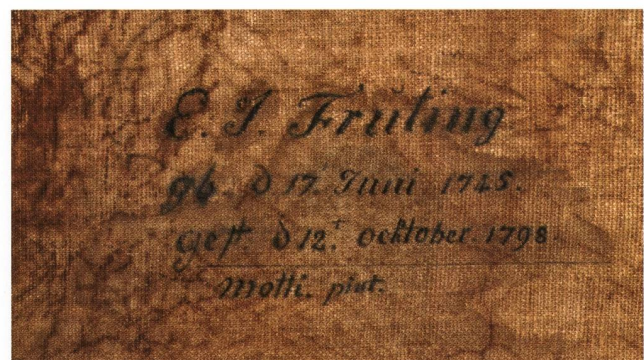
Abb. 2: Beschriftung des Bildes auf der Rückseite. Die angegebene Malersignatur «Motti pint.» kann nicht aufgelöst werden.

E. J. Fruting gb. d. 17. Juni. 1745. gest. d. 12. t Ocktober .1798. Motti. pint.