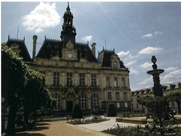
Limoges – Hotel De Ville.