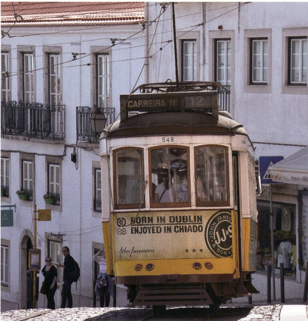
Tram in der Altstadt von Lissabon.

Fünf Tage bei strahlendem Sonnenschein und mit sommerlichen Temperaturen bescherte Lissabon den 15 Keramikfreunden. Am ersten Reisetag traf sich die Gruppe, die teilweise individuell angereist war, auf der Dachterrasse unseres Hotels Do Chiado mitten im Stadtzentrum mit wunderbarem Blick auf die Burg, die Lissaboner Altstadt und den Tejo-Fluss. Nach einem kurzen historischen Überblick über die wechselhafte Geschichte Portugals durch die Reiseleiterin erkundeten die Keramikfreunde die nach dem Erdbeben von 1755 erbauten Stadtteile, bevor wir das Abendessen in einem typischen Fado-restaurant genossen. Verschiedene Sänger und Sängerinnen traten zwischen den