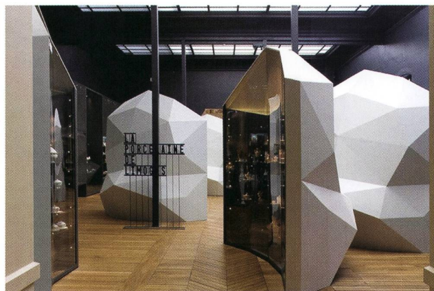
Musée Adrien-Dubouché.