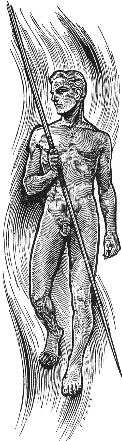
Speerträger Porteur de lance

Zeichnung von WILHELM KNABE 1943 Dessin de