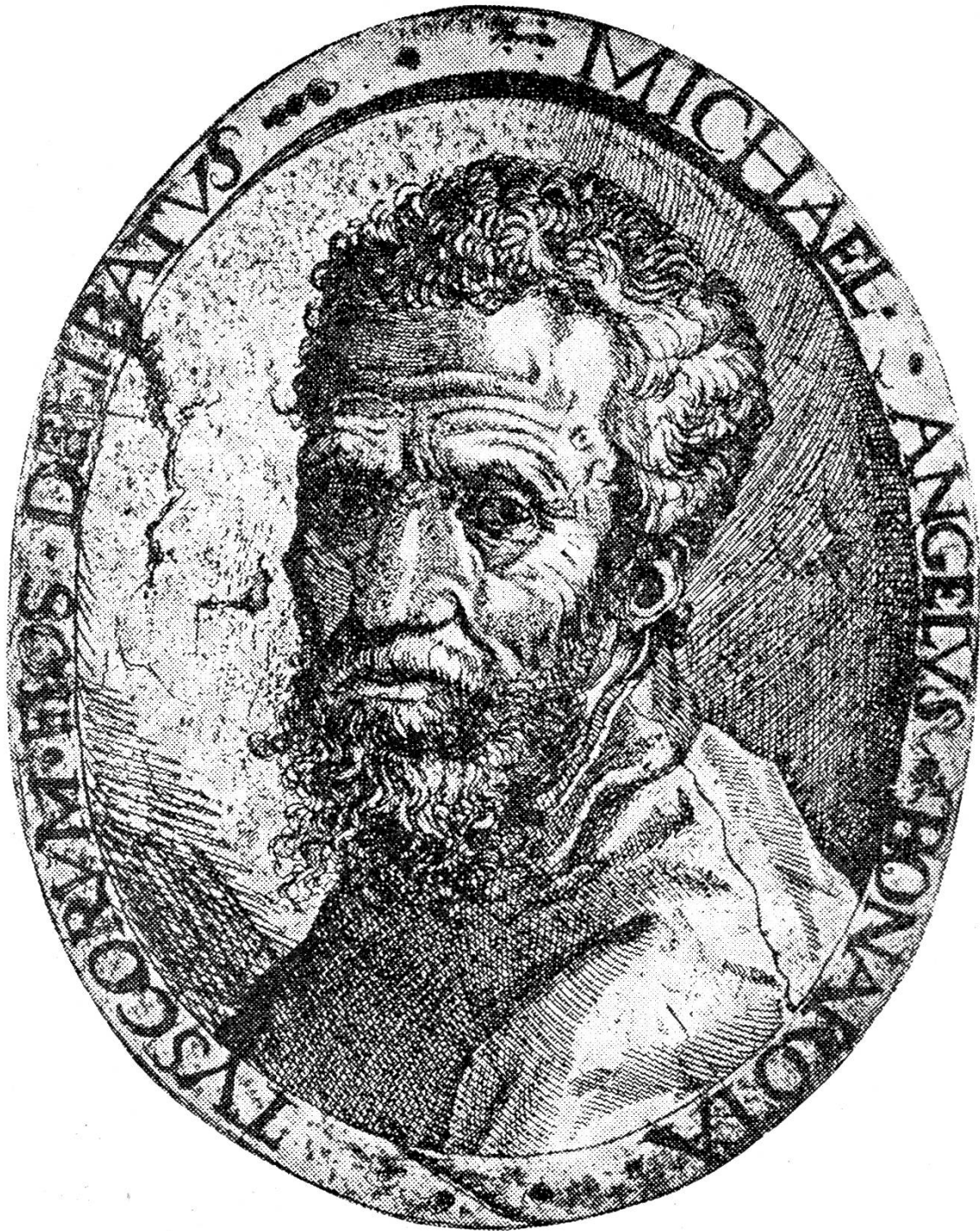
Michelangelo, Radierung eines unbekanntes Meisters. Um 1560

Zum 400. Todestage des Michelangelo Buonarroti: 18. Febr. 1564