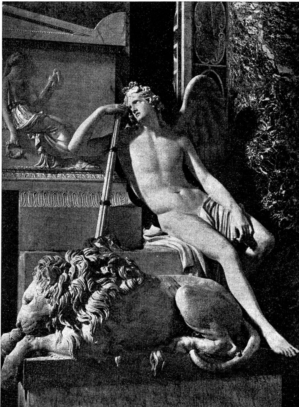
Antonio Canova 1757–1822