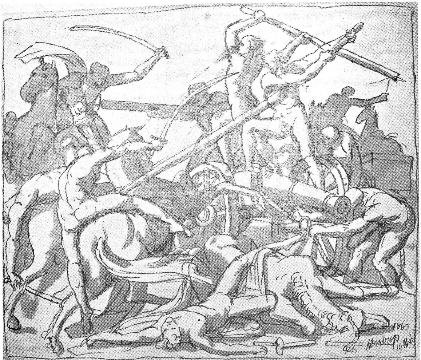
Theodor Mintrop, 1814–1870

Der Kampf um die Kanone Lavierte Federzeichnung.